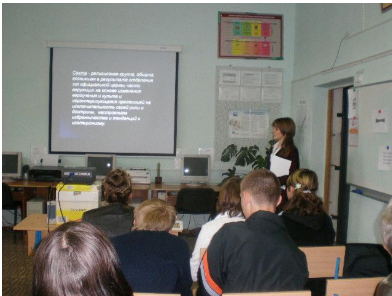
Открытие шахматного клуба “Ладья”